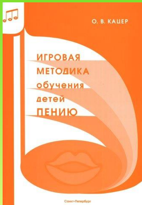
Автор: О.В. Кацер