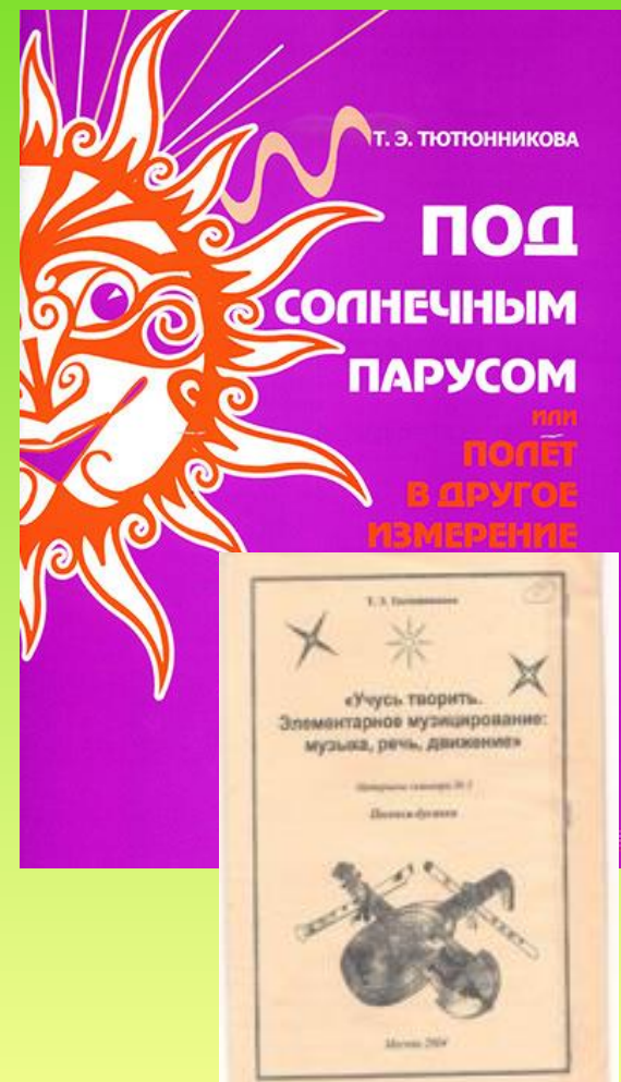
Автор: Т.Э. Тютюнникова